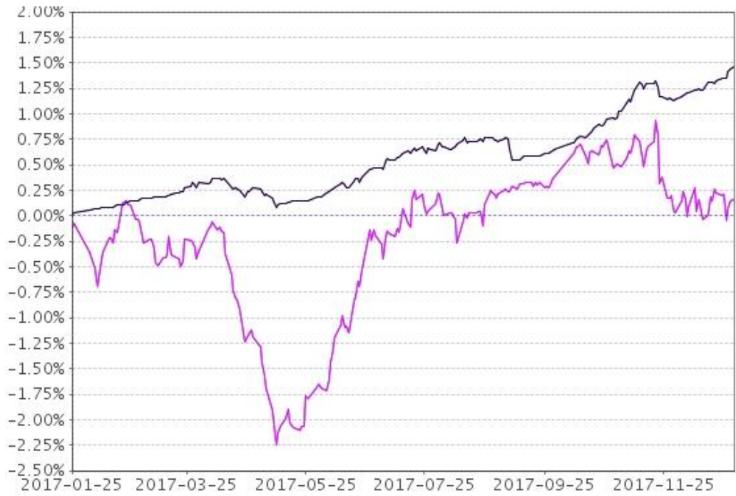
— 富国富利稳健配置混合型A — 比较基准 — 富国富利稳健配置混合型A — 比较基准